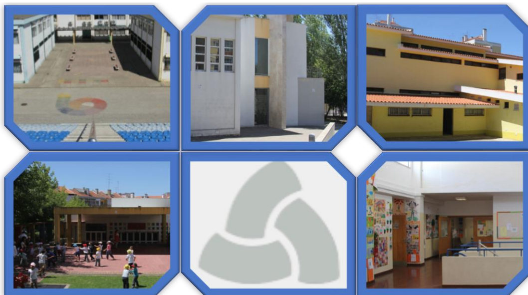
Ji da Damaia